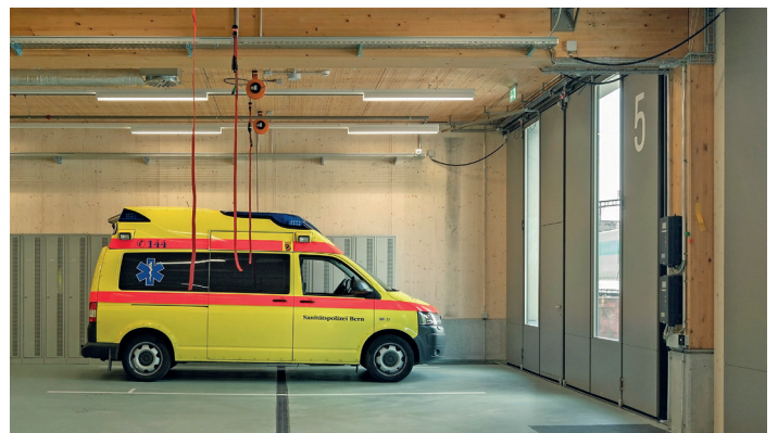
Illustration: Dominique Wehri

Le nouveau bâtiment qui abrite les services de secours et la centrale des appels sanitaires urgents du canton de Berne a été érigé en bois conformément aux exigences du standard Minergie-ECO. L'ouvrage a été construit entièrement en bois, à l'exception de la surface de circulation et des plafonds, qui allient le bois et d'autres matériaux. Pour la construction de ce bâtiment, on a opté judicieusement pour une séparation des systèmes, qui permet en effet un renouvellement des différents éléments de construction sur la base de leur cycle de vie, une utilisation flexible du bâtiment, ainsi qu'une élimination facile des matériaux. La statique de cet ouvrage en bois permet par ailleurs sa surélévation jusqu'à trois niveaux. ( lien )