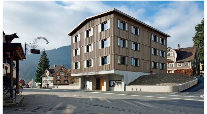
Illustration: Ralph Feiner

Bois indigène: Suite à une décision du conseil municipal, le nouveau bâtiment communal de Nesslau devait être construit au moyen de bois indigène, issu de la forêt avoisinante. Le projet a été mis au concours, et c'est une offre de construction mixte qui a passé la rampe. En sa qualité de maître d'ouvrage, la commune avait demandé aux entrepreneurs d'exposer, lors de la remise de l'offre, la chaîne de production des éléments en bois, dès leur point de départ dans la forêt jusqu'à leur incorporation dans le nouveau bâtiment communal. ( lien )