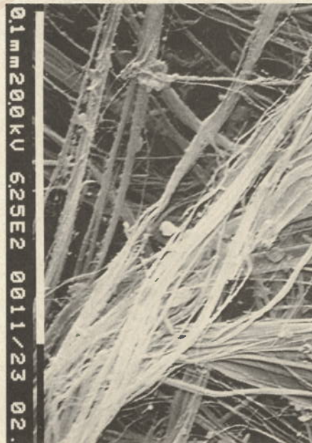
Fibres minérales (ci-dessus) en comparaison aux fibres d'amiante.